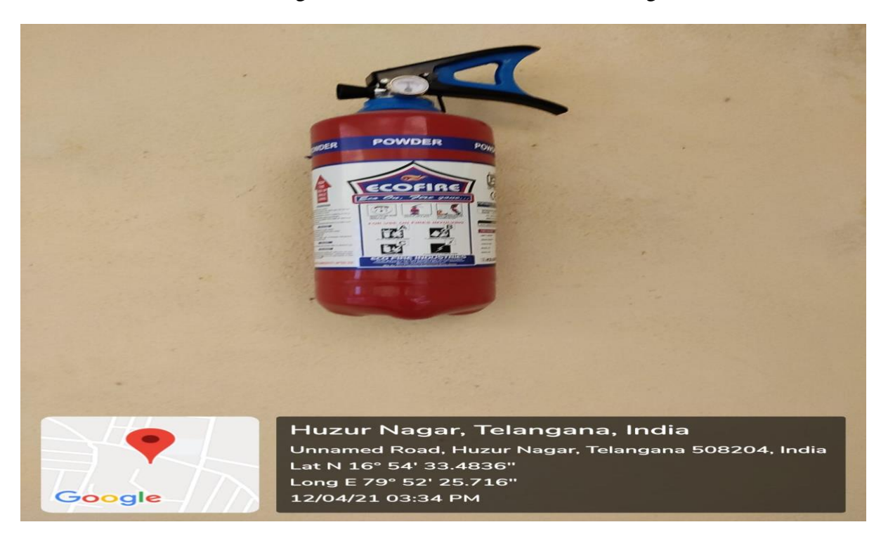
Fire Extinguisher at Auditorium of the GDC, Huzurnagar