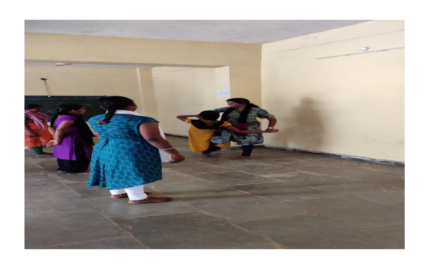
Students practising karate