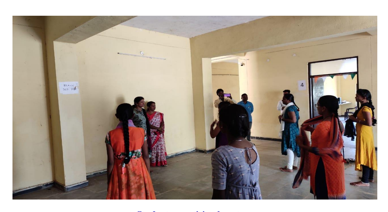
Students practising karate