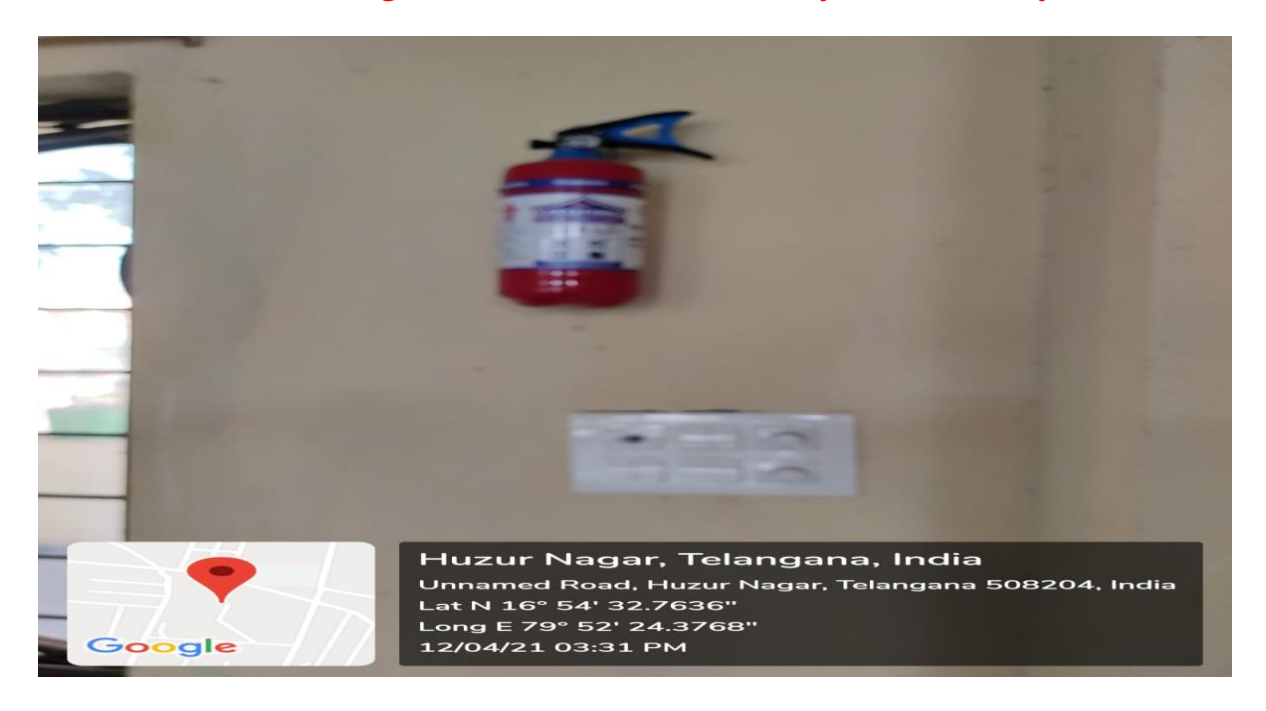
Fire Extinguisher at Office of the GDC, Huzurnagar