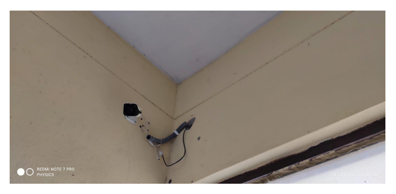
CC CAMERA IN OFFICE ROOM