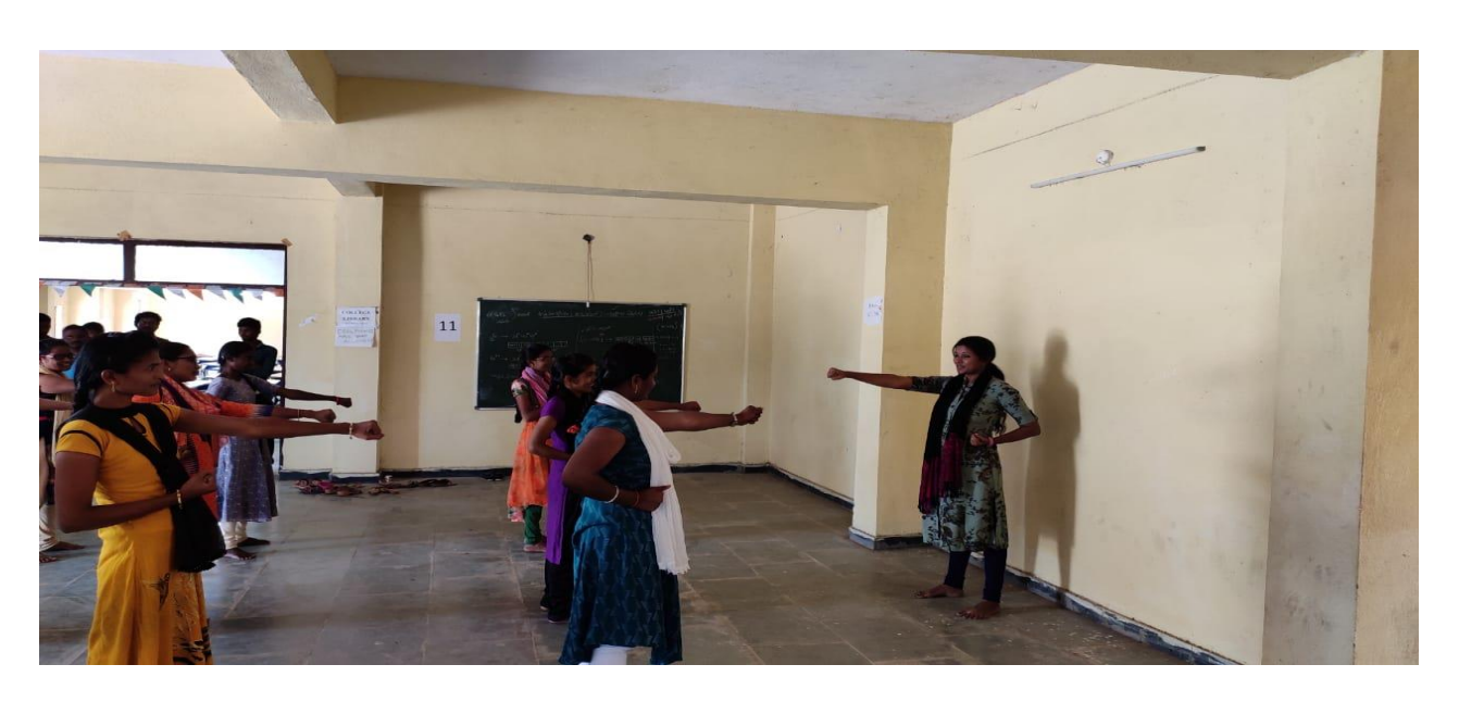
Students practising karate