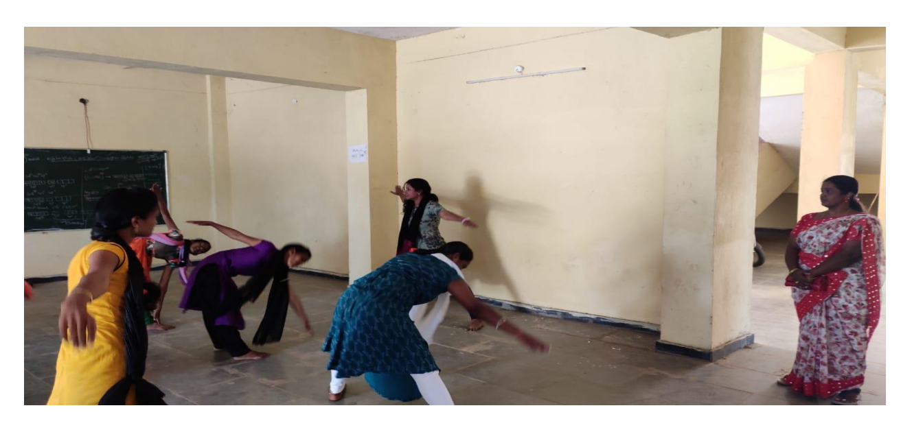
Students practising karate